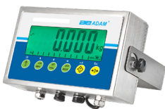
Indicador AE 403