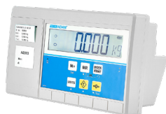
Indicador AE 503