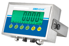
Indicateur AE 403