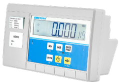
Indicateur AE 503