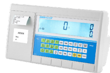
Indicateur AE 504